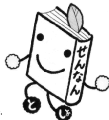
図書館のマスコット《とこしよ》